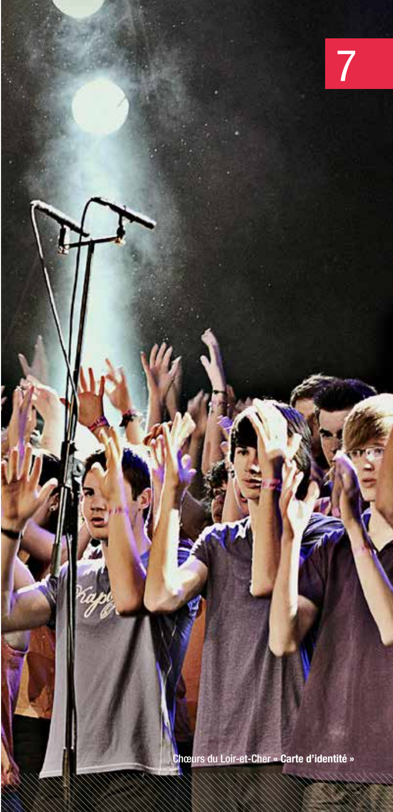
Chœurs du Loir-et-Cher « Carte d'identité »