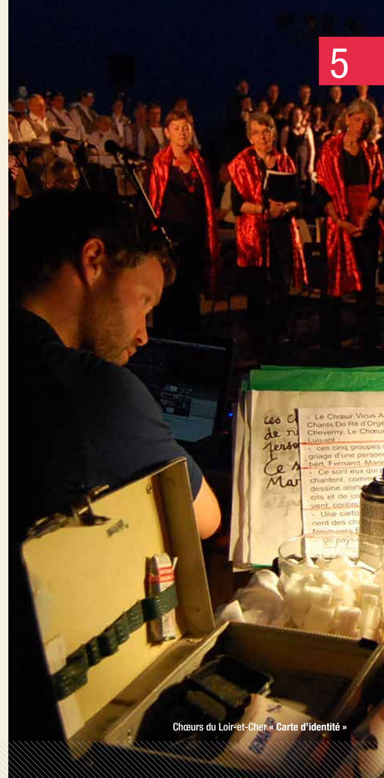
Chœurs du Loir-et-Cher « Carte d'identité »